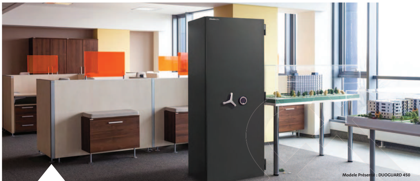
Modele Présenté : DUOGUARD 450