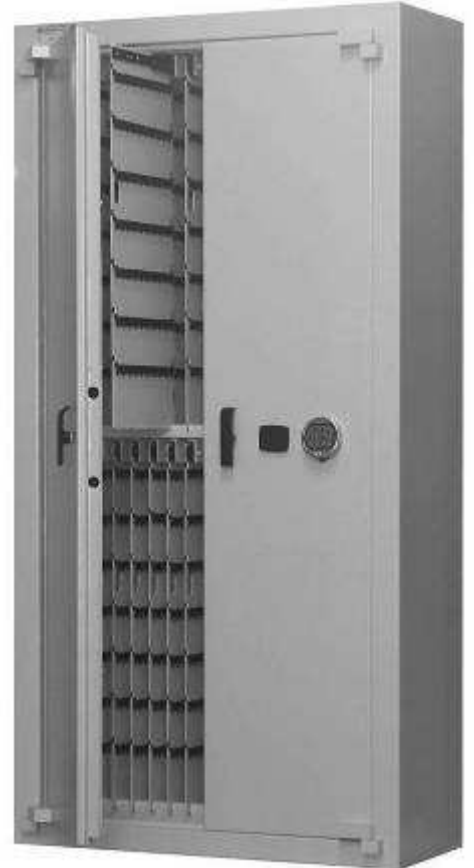
CC 4256 Clavier Electronique