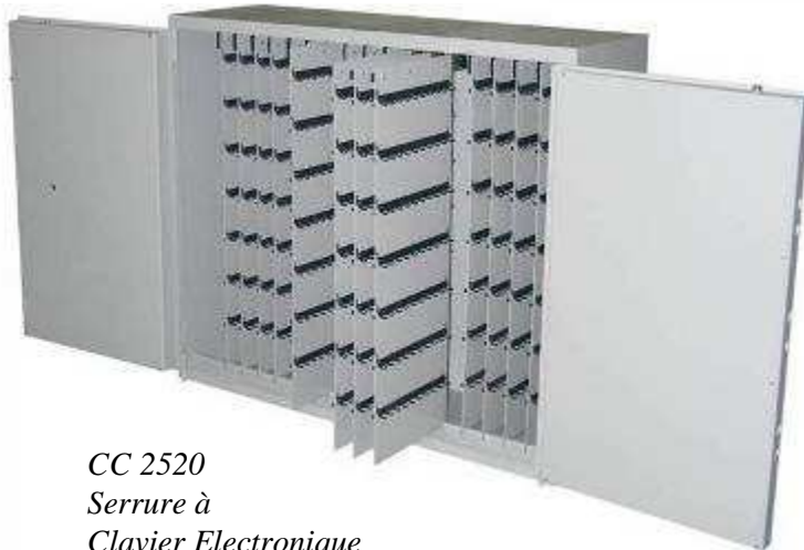
CC 2520 Serrure à Clavier Electronique