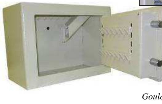
CC 20 avec Goulotte de dépôt