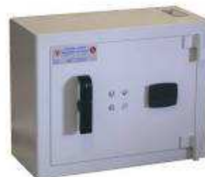
CC 50 Avec goulotte de dépôt