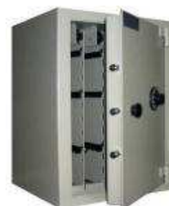
CC 216 CD