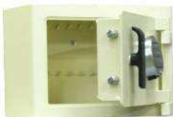
CC 20 CE