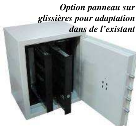
Option panneau sur glissières pour adaptation dans de l'existant