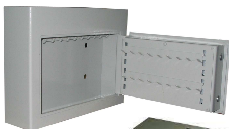
TA Bloc DFC pour clés Serrure LG BASIC