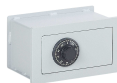
Coffre dernière clé 10 CD