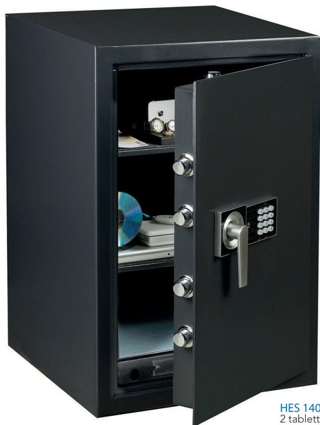
HES 140 2 tablettes réglables en hauteur.