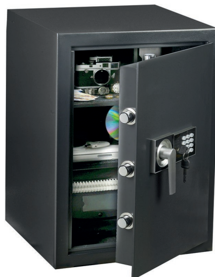
HES 90 2 tablettes réglables en hauteur.