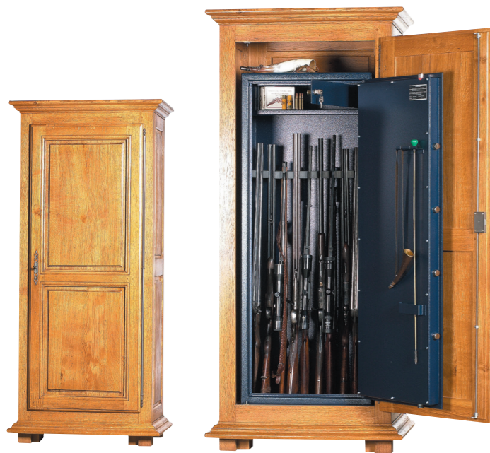
WT 310 (présenté dans son meuble en chêne massif en option).