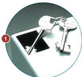
Trappe de dépôt de clés avec chicanes anti-pêches en série sur Clés Protect 10/30/60/100.

RAILS D'ACCROCHAGE DE CLÉS RÉGLABLES SUR CRÉMAILLÈRES. BLINDAGE AU MANGANÈSE DU SYSTÈME DE CONDAMNATION. COLORIS GRIS CLAIR RAL 7035. OUVERTURE DES PORTES À 100°.