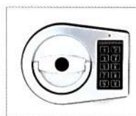
Serrure électronique norme Européenne ENV 1300 classe 2 VDS. 1 000 000 de combinaisons, 1 code maître et 1 code utilisateur programmables. Alimentation par pile de 9 volts accessible sous le clavier.