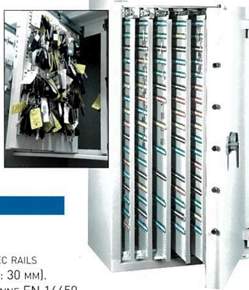
Clés Protect 2520. Avec 6 panneaux extractibles.